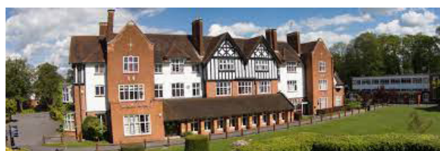
Reed School in Cobham

HBG vroeg hem in 1988 om voor vijf jaar met zijn vrouw en de twee kinderen naar Engeland te verhuizen. Als financial controller heeft hij bij Nuttall succesvol de administratie en financiële rapportages ingericht naar HBG-model. Ze woonden toen in de plaats Woking in het Graafschap Surrey, zo'n 35 km. ten zuidwesten van Londen. De kinderen gingen er naar de Nederlandse lagere school, eerst bij de American Community School en later op de Shell-school. Nederlands middelbaar onderwijs kregen ze, in schooluniform, bij Reed School in Cobham waar de Engelse dependance van het Rijnlands Lyceum uit Wassenaar onderdak had. Begin jaren negentig was de klus geklaard en verhuisden ze terug naar