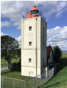
Vuurtoren De Ven Enkhuizen

Met een lengte van 29 meter beschikt Nijmegen sinds kort over de langste betonnen 3D-fietsbrug ter wereld. Het project is uniek omdat de fietsbrug in volledige vormvrijheid is ontworpen, dankzij onderzoek aan de Technische Universiteit Eindhoven en de doorontwikkeling van de 3D-betonprinttechniek. De brug is laagje voor laagje geprint in de betonprintfabriek van Saint Gobain Weber Beamix en gerealiseerd door bouwconcern BAM.