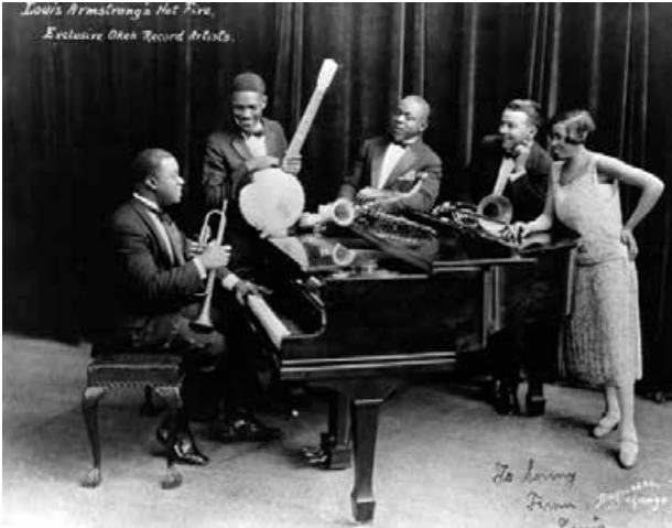
Louis Armstrong and his "Hot Five" – Louis met trompet achter de piano, rechts zijn vrouw Lil Hardin

Louis Armstrong ging het snel minder goed met de band. Hij ontwikkelde zich met zijn geweldige spel en zang tot een fenomeen. Het was moeilijk om een orkest samen te stellen met muzikanten met hetzelfde niveau. Dat lukte met zijn "Hot Five" en "Hot Seven" (1924 – 1927). In "Hot Five" speelde zijn vrouw Lil Hardin op de piano. In die tijd bijzonder, een vrouw achter de piano en zij kon noten lezen. Ze had namelijk een klassieke opleiding gehad. Louis trok zich verder niets aan van conventies en deed alles op zijn eigen wijze. Zo werd het hem kwalijk genomen, dat hij zich inliet met blanke muziek. Een deel van zijn collega's zag hen als een verrader. Maar dat deed hem niet, hij ging gewoon door. Hij trad later ook heel veel op met Ella Fitzgerald. Zowel voor als na de Tweede Wereldoorlog toerde hij door Europa. Al met al een groot muzikant en een icoon van de New Orleans Jazz.