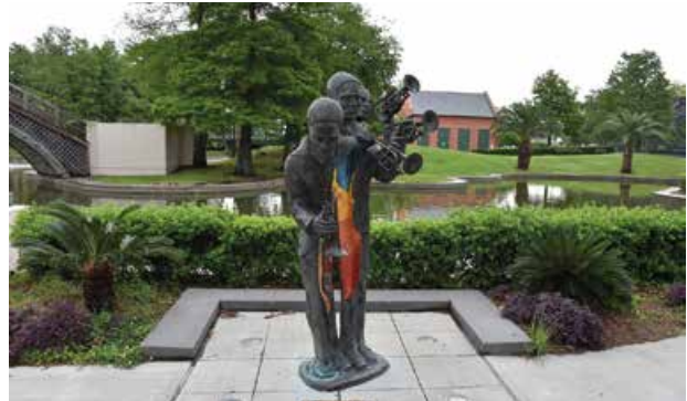
Standbeeld Buddy Bolden in Louis Armstrong Park

Het grote succes was te danken aan de pioniers van die muziek. Hoewel er vele muzikanten en goede bands zijn haal ik er een paar naar voren die ik zelf zeer bijzonder vind.