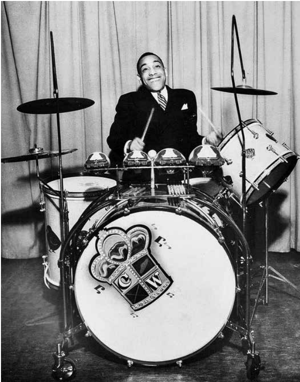
Chick Webb achter zijn drumstel

De band werd toen even voortgezet door Ella Fitzgerald, die zeer bekend was geworden als zangeres van de band. Maar zij was geen bandleider en dus viel de band spoedig uit elkaar. Ella zocht haar eigen begeleidingsensembles. In de tijd dat ze bij Chick Webb zong, heeft ze een van haar beroemdste liedjes gezongen. "A tisket, a tasket". Een kinderliedje, dat zij met een zeer menselijke stem zong als een meisje dat graag zingt. Zij heeft zich daarna ontwikkeld tot de zangeres, zoals we die nu kennen. De zangeres met een grote kracht en uitdrakkingsvermogen, die de emotie goed weet over te brengen.