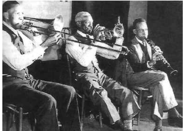
Deel van het orkest van Bunk Johnson. V.l.n.r. Jim Robinson- trombone, Bunk Johnson-trompet en George Lewis-klarinet