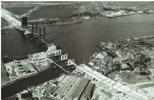
Aanleg Van Brienoordbrug, Rotterdam