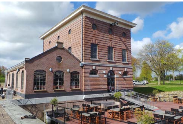
Door Jan Blanken ontworpen pomphuis bij droogdok; nu restaurant Fortezza

Het geheel wordt van het buitenwater gescheiden door een zogenaamde vlotdeur, ook wel schipdeur of bateau porte genoemd, een Franse uitvinding. Een drijvende holle constructie die in en uit kan worden gevaren. Door de deur te vullen met water zakt deze op zijn plek en sluit het dok af. Door het water er weer uit te pompen gaat hij drijven en kan zo verplaatst worden. De eerste deur was nog van hout. De huidige werkende stalen deur stamt uit 1884. In de wanden van de dokken loopt rondom een aquaduct (omloopriool) voor het inlaten en wegpompen van water voor het verplaatsen van een schip en voor bluswater in geval er brand uitbreekt.