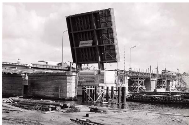
Brug over Oude Rijn