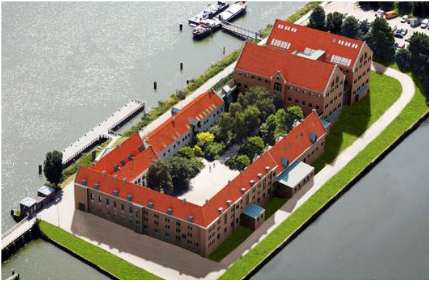
Museum 20 ste Eeuw

Al met al een trieste opsomming van afgelastingen. Voor onze leden moet dat een bittere teleurstelling zijn omdat onze activiteiten zich jaarlijks in een warme belangstelling mogen verheugen. De Activiteitencommissie baalt daar ook behoorlijk van, vooral omdat er al veel tijd en energie was gestoken in alle voorbereidingen, maar het is even niet anders. Overmacht, zullen we maar zeggen en we hopen dat we in 2021 weer vol aan de bak kunnen.