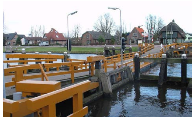
De Koedijkervlotbrug in het Noordhollands Kanaal bij Alkmaar, nog steeds in gebruik.