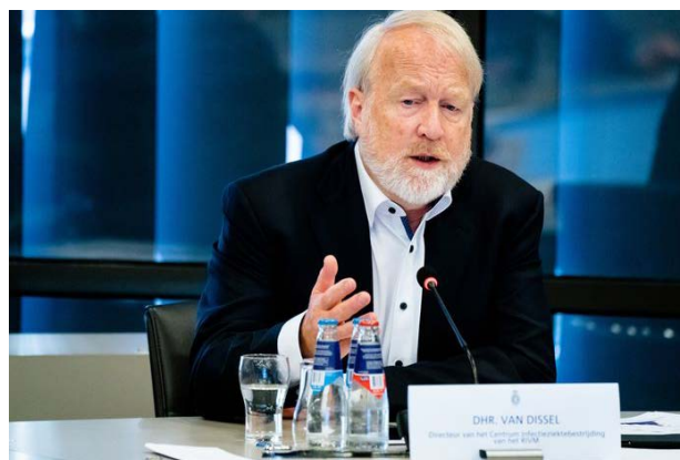
Jaap van Dissel

De ziekte is vooral gevaarlijk voor ouderen met, zoals dat heet, onderliggende gezondheidsproblematiek. Onze nationale nerd Jort Kelder had het over gepensioneerde oude mannen met dikke buiken, diabetes en een pacemaker. Dat klinkt niet gezellig, maar had hij hier toch een punt?