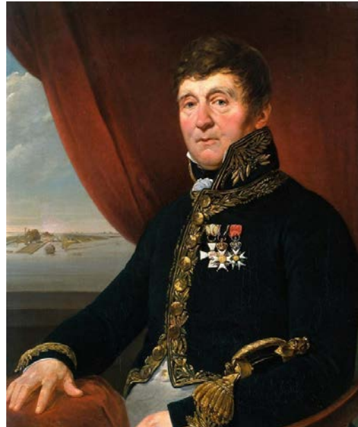
Jan Blanken als Inspecteur-Generaal, gedecoreerd met de Rode Adelaar van Pruisen, de Orde van de Nederlandse Leeuw en de Orde van het Legioen van Eer

Zijn waterbouwkundige ambities, zijn inzichten, zijn vasthoudendheid aan zijn ideeën, zijn doorzettingsvermogen en de kunst zich aan te passen aan de tijdgeest waren aansprekende eigenschappen. Hij past, wat mij betreft, in het rijtje van onze grote waterbouwkundigen zoals Jan Adriaanszoon Leeghwater (1575-1650; de man van de droogleggingen van grote waterplassen), Nicolaas Samuelis Cruquis (1678-1754; de man met ideeën over uitwateringssluizen), Cornelis Lely (1854-1929; de man van de afsluitdijk en drooglegging van de Zuiderzee) en Johan van Veen (1893-1959; die een watersnoodramp voorzag en al plannen had opgesteld voor afsluiting van de zeearmen, de latere Deltawerken).