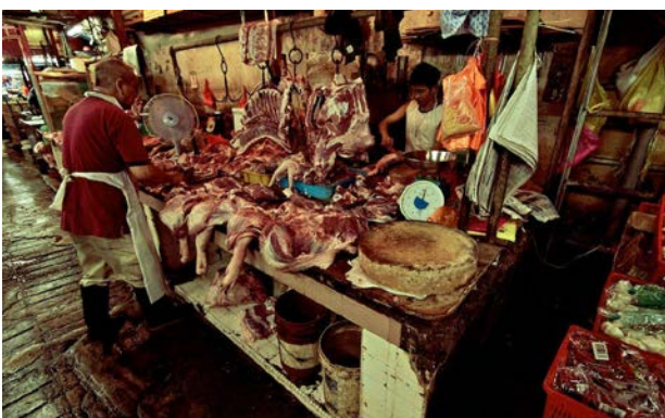
Markt in China

en daarbij de cel vernietigde. De echte erkenning kwam later. De wetenschap was nog vol van de ontdekking van de bacterie als ziekteverwekker. De bacteriologie kwam mede door de Duitser Robert Koch in de jaren 1880 net opzetten. Ziektes zijn van alle tijden en alle soorten van levende wezens hebben zo hun eigen ziekteverwekkers en hun eigen afweersystemen. Het wordt spannend als deze ziekteverwekkers overgaan van bijvoorbeeld dier naar mens (zoönose). Die kans werd groter toen dieren gedomesticeerd werden en de concentraties van mensen met hun dieren toenam. Verspreiding ging sneller door hongersnoden vanwege misoogsten of door klimaatinvloeden of oorlogen met als gevolg minder weerstand onder de bevolking. Die oorlogen brachten ook grote groepen mensen op de been die door landen trokken en elkaar ontmoetten. Ook contacten door handelskaravanen en handel in het algemeen zorgden voor ruime verspreiding. Toen de pest in de 14 de eeuw door Europa trok, bedachten de inwoners van het Italiaanse Reggio een manier om zich te beschermen. Reizigers mochten de stad pas in nadat was gebleken dat ze, na een verblijf buiten de stad, niet ziek waren geworden. In 1400 bepaalde Venetië die periode op 40 (quaranta) dagen, waarschijnlijk afgekeken van de 40 dagen durende kerkelijke vastenperiode. Het woord quarantaine gebruiken we nog steeds.