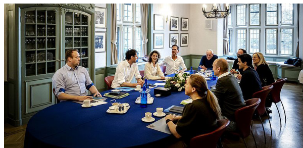
De formatie duurt voort

Wie weet hoeveel informateurs we dit jaar al hebben zien komen en gaan? Jorritsma, Ollongren, van Ark, Koolmees, Tjeenk Willink, Hamer, Remkes en weer Koolmees. Dat zijn er acht op het moment dat ik dit stukje schrijf. Mogelijk kunnen de oplettende lezers deze lijst inmiddels alweer aanvullen met nieuwe namen. De Koepel Gepensioneerden heeft het er druk mee. Bij iedere nieuwe informateur melden ze zich met een pleidooi voor hervatting van de indexering van onze pensioenen. Het demissionaire kabinet brandt zijn vingers hier niet aan en of Rutte 4 vóór 2022 van start gaat en tijdig een besluit neemt, betwijfel ik. Dit schrijf ik medio november. De lezer weet inmiddels meer.