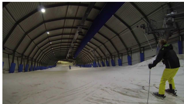
Skidôme in Rucphen

paniek, maar 'loos alarm'. Toen maar besloten naar huis te gaan. In Oostende ging de zon weer schijnen. Geweldig toch!