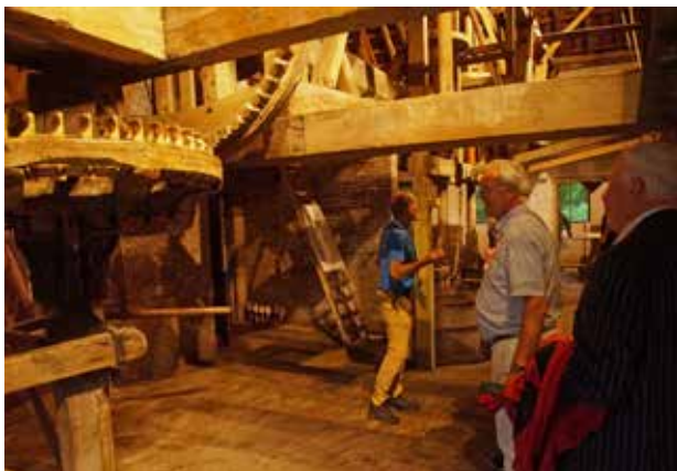
Interieur van wasserij uit circa 1910

verhalen van onze gids een heel mooi beeld gegeven werd hoe men vroeger leefde, met welke materialen er gewerkt werd en waar oude gebruiken voor dienden (Marjolein nog bedankt voor het lenen van je paraplu).