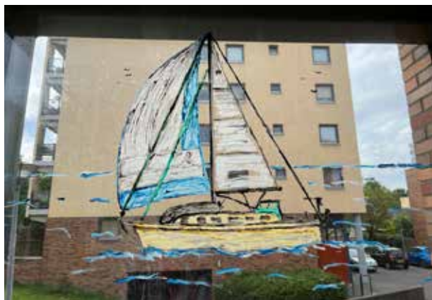
De Artemis op een windscherm thuis

In de Caraïben beviel het goed. Gedurende vier jaar verkende hij al zeilend het gebied. Toen trok de Pacific: de Stille Oceaan. Via het Panamakanaal bereikte hij dit uitgestrekte paradijs. Een prachtige tijd daar, varende van eiland naar eiland, er zijn er een paar duizend. Vervolgens tien jaar Nieuw Zeeland, waar zijn dochter hem kwam opzoeken. Het beviel haar daar zo goed dat ze er is gaan wonen – ze woont er nog steeds. En ja, het vele alleen zijn, soms weken achter elkaar op de oceaan, het was wennen maar het beviel goed.