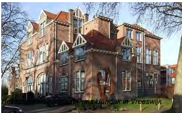
Het schippersinternaat, Prins Hendrik in Vreeswijk