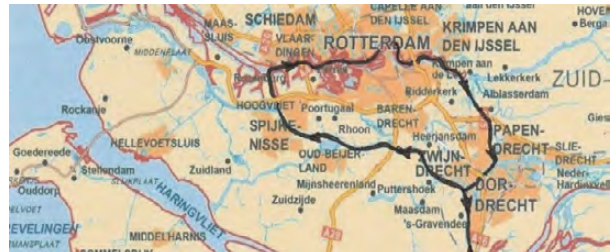
De vaarroute, rechtsom met de zon mee

splits de Noord zich in Beneden Merwede en Oude Maas waar we nogmaals stuurboord uit de Oude Maas opvaren, om bij Zwijndrecht bakboord uit weer de Dordtsche Kil in te gaan.