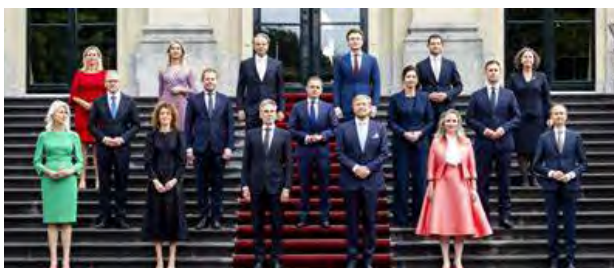
Kabinet Schoof in betere tijden

Terug naar de bestuurstafel. Recent stond het pensioenstelsel opnieuw in de politieke belangstelling. In het kabinet en de Tweede Kamer werd uitvoerig gesproken over de voortgang van de overgang naar het nieuwe pensioenstelsel. Uiteindelijk leidde dit niet tot aanpassingen. Op 3 juni viel het kabinet. Het is nu afwachten welke beleidsonderwerpen door de Tweede Kamer controversieel worden verklaard. Het demissionaire kabinet kan daarmee dan niet aan de slag. De wijsheid die men mag verwachten van een volwassen kabinet, is uiteindelijk helaas niet tot volle wasdom gekomen. Zonder partij te kiezen, durf ik wel te zeggen dat het politieke schouwspel bijzonder was.