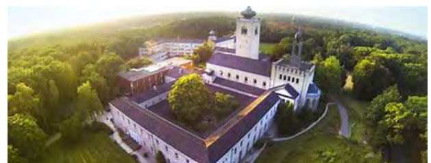
Leerhotel Het Klooster

De wens om bij excursies (weer) wat vaker BAM-werken te bezoeken komt regelmatig langs. De Activiteitencommissie houdt de mogelijkheden scherp in de gaten, maar in de praktijk blijkt dit door strengere veiligheids- en privacyregels steeds lastiger te worden voor grote groepen. Bij omvangrijke werken kan een bezoekerscentrum uitkomst bieden, maar de informatie daar is algemener dan wij als betrokken bouwers zouden wensen.