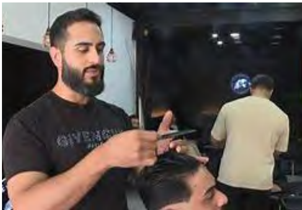
Is niet de kapsalon van Timmerman

daarvoor ook nog van tevoren een afspraak zou moeten maken. Voor vijf minuten werk in de laagste tondeusestand, nr 3?