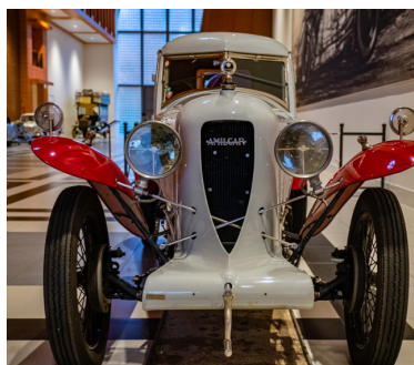
Louwman Automuseum Den Haag

Het programma voor dit jaar 2026 heeft de commissie al grotendeels ingevuld. Bij de voorjaarsexcursie op dinsdag 14 april maken we vanuit Drimmelen een veelzijdige vaartocht vol historie, waterbeleving en natuur door het land van Heusden & Altena en de Biesbosch. De voorjaarsbijeenkomst met de Algemene Ledenvergadering (ALV) op woensdag 3 juni beleven we bij Burgers Zoo in Arnhem met in de middag interessante rondleidingen door de Bush, Mangrove en Ocean. De najaarsbijeenkomst voert ons in september op twee dagen naar het Oude Ambachten & Speelgoed Museum in Terschuur en naar de fraaie Zandsculpturen in het nabij gelegen Garderen. Begin november brengt de najaarsexcursie ons ook twee dagen naar het Louwman Automuseum in Den Haag/Wassenaar met rondleidingen door de weer verder aangevulde collectie. Voor de sportievelingen beleven we op vrijdag 17 juli het eerste lustrum van de Petanque-middag in Gouda en op donderdag 20 augustus gaan we traditiegetrouw golfen (inclusief een clinic) op de banen van golfclub De Scherpenbergh in Lieren bij Apeldoorn. Voor een overzicht en meer informatie bezoek je onze website.