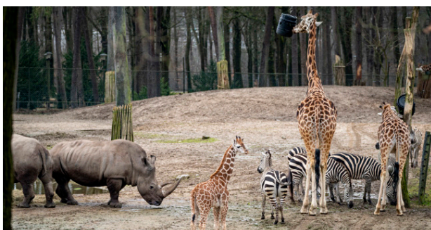
Burgers Zoo Arnhem

In 2025 kregen we te maken met twee heuse hittegolven. Gezien de klimaatontwikkeling is het verstandig om hierop voorbereid te zijn. Om die reden heeft de AC een hitteplan opgesteld waarin is aangegeven hoe te handelen als er tijdens geplande recreatieve dagen een hittegolf wordt voorspeld. Het nieuwe hitteplan hoefde nog niet in werking te worden gesteld. Meer is te lezen in het komende Jaarverslag 2025. Alle uitgebreide verslagen met mooie foto's van verschillende deelnemers staan in de BAMformaties uit 2025 op onze website. Partners van de commissieleden en een aantal bereidwillige leden hebben weer meegeholpen, waarvoor hartelijk dank.